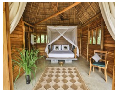
Gal Oya Lodge

Flüge mit anderen Fluggesellschaften sind jederzeit möglich! Diese Reise wird mit einem Emirates Special Tarif angeboten. Fragen Sie die aktuellen Specials an.